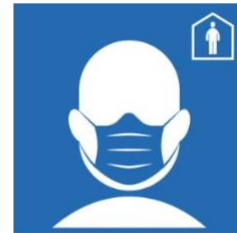
FFP2 Maske tragen!